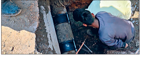
हरिभूमि न्यूज ▶▶ रायपुर

नगर निगम जोन 2 क्षेत्र स्थित रमण मंदिर वार्ड में पिछले एक सप्ताह से नर्मदापारा और चूना भट्टी इलाके में अचानक पीने के पानी की समस्या आ रही थी।